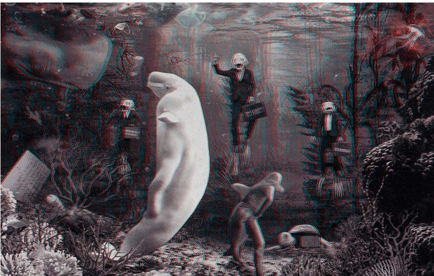
Goshka Macuga, Who Gave Us a Sponge to Erase the Horizon?, 2022

Anmeldung über Dana Wehlert: tutorinkupaed@hfbk-hamburg.de