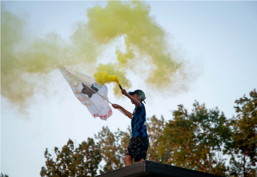
Nightwalks with Teenager, Bologna 2022