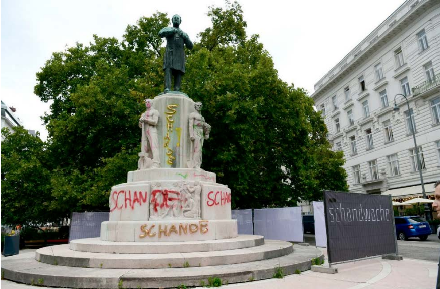
Schandwache – Vigil of Disgrace, Intervention in public space by Anna Witt, Simon Nagy, Gin Müller, Mischa Guttmann and Eduard Freudmann (2020)

Im SoSe 2023 fand an der HFBK der 3-tägige Workshop »Sich Konflikten stellen« statt, der sich ausgehend von den Debatten um die documenta fifteen mit Antisemitismus und Rassismus in der Kunst und ihrer Bedeutung für die künstlerische Praxis beschäftigt hat. Im SoSe 2024 wird das Projekt in Wien an der Akademie der Bildenden Künste fortgesetzt. 10 Studierende der HFBK Hamburg sind zusammen mit 15 Studierenden der Ungarischen Akademie der bildenden Künste, der Kunsthochschule Berlin-Weißensee sowie der Salzburger Sommerakademie zu gemeinsamen Workshops eingeladen.