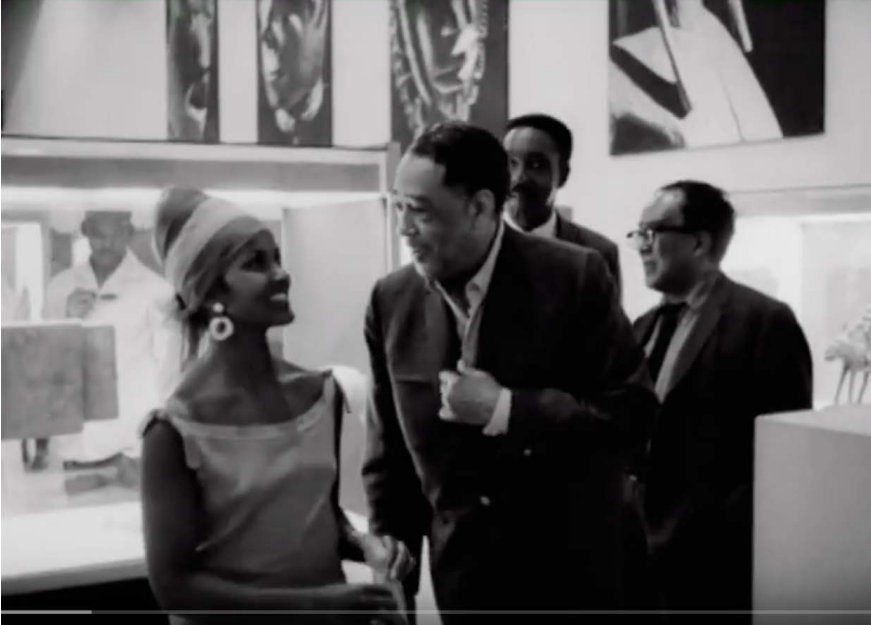
Filmstill: William Greaves (dir.), First World Festival of Negro Arts, Dakar 1966, distributed by William Greaves Productions, New York, 2005

Anmeldung über Dana Wehlert: tutorinkupaed@hfbk-hamburg.de