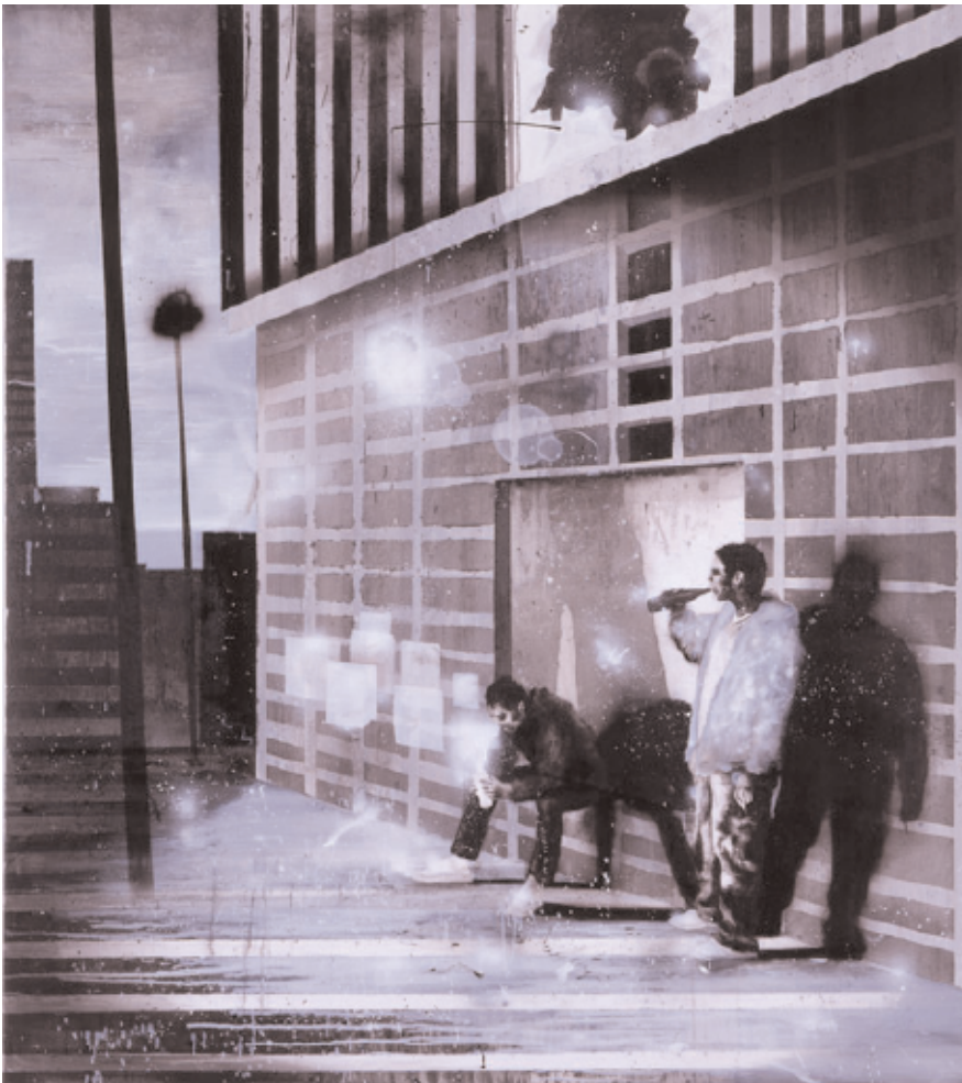
Henning Kles, »Bravo Rio«, oil and paint on canvas, 180 x 160 cm, 2006, Courtesy: Arndt & Partner Berlin / Zurich, Private Collection, USA

MARTE KIESSLING | »FRÁBÆRT« Was macht man sieben Monate lang auf einer Insel wie Island? Wo es im Winter kaum hell wird und im Sommer die Sonne beinahe nie untergeht? In einem Land ohne Bäume, mit kaum vorhandenen Siedlungen und selten geteerten Straßen, außerhalb der kleinsten Großstadt der Welt, Reykjavik? In einem Land mit offiziell 180 000 Einwohnern, deren Zahl nach Auskunft der Parapsychologen und internationalen Medien jedoch dank der »Unsichtbaren«, der Elfen und Trolle nämlich, glatt auf eine Million zu beziffern ist. In einem Land, in dem Karotten mit Gold aufgewogen werden und die Sprache beinahe unaussprechlich ist? Man fotografiert, filmt und reist mit einem klapprigen Fiat Punto über ausgewaschene Jeepspuren. Man badet in heißen Quellen. Und man schließt sich der is-