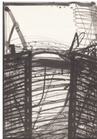
K.R.H. Sonderborg, »Minneapolis«, Tusch auf Papier, 730 x 1018 mm, 1969/70