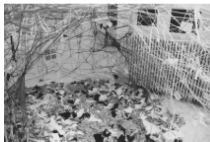
Ricarda Hoop, »Raum K25A«, Rauminstallation, 2006