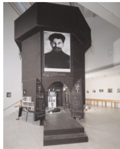
»Soldat Meese (Staatsanimalismus). Maldororturm«, 2000; Installationsansicht, Museum Abteiberg, Mönchengladbach 2000

MEESE: Das scheinen schon logische Konsequenzen, dessen, was ich tue, zu sein, aber immer abgeleitet von Befindlichkeiten. Diese Menschen, die das so schreiben,