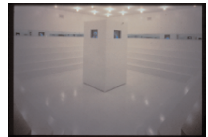
Adrian Piper, Installation »What It's Like, What It Is«, 1991