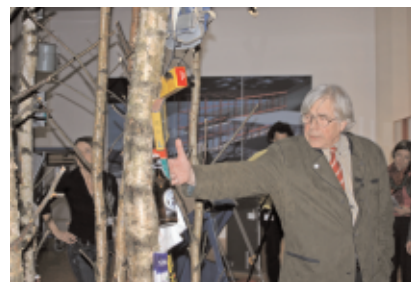
Bazon Brock, »Lustmarsch durchs Theoriegelände / Kontrafakte. Karfreitagsphilosophie – Der Faschist als Demokrat«, ZKM | Zentrum für Kunst und Medientechnologie

PERFORMANCE MO 22.5. 16.00 Demonstrationsumzug zum Thema »Gott und der Müll« von der kestnergesellschaft in die Hannoveraner Innenstadt